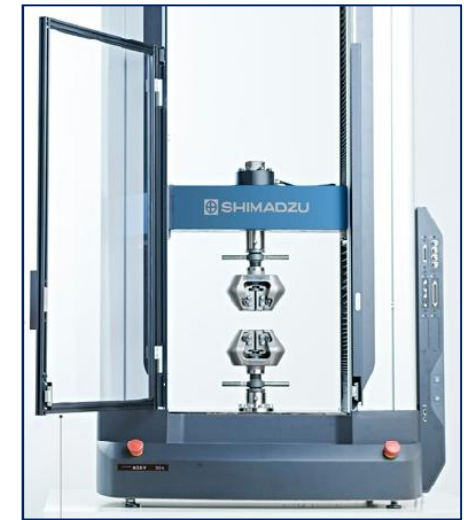
AGX-VD 50kN Desktop Modell

Avec AGX-V Desktop ou Floor Type, Shimadzu offre une série de machines de table ou de sol haut de gamme, robuste et en même temps élégante.